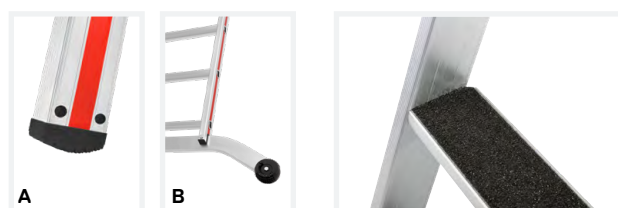
A Tacos interiores atornillados B Travesa curvada